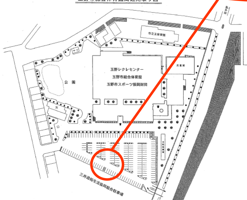
玉野市総合体育館周辺見取り図

斜線箇所は駐車できません。 ※工事箇所以外の駐車場は通常通りご利用いただけます。 ※天候や工事の状況により、日程が前後する場合があります。ご了承ください。